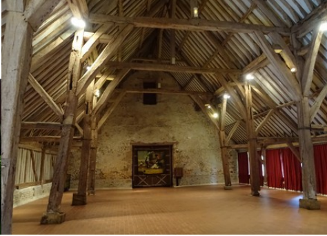
La charpente de la grange