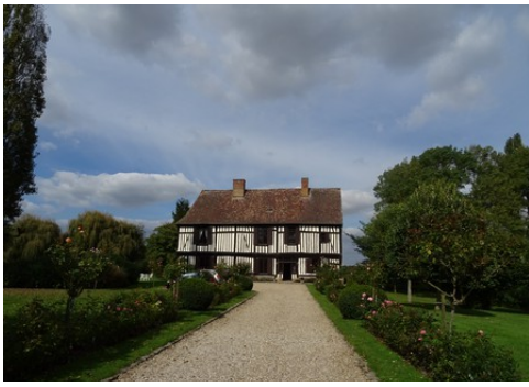
La façade sud du manoir (vue éloignée)