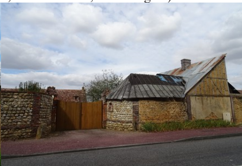
Un portail d'entrée