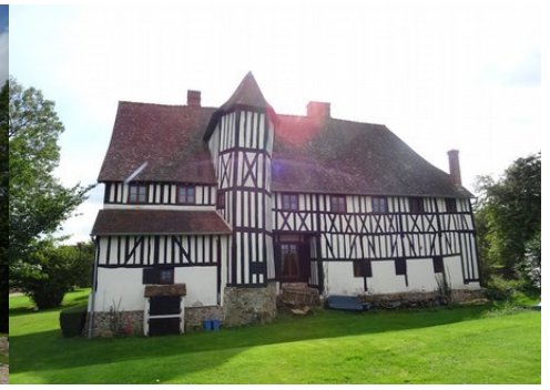
La façade nord avec la tour d'escalier