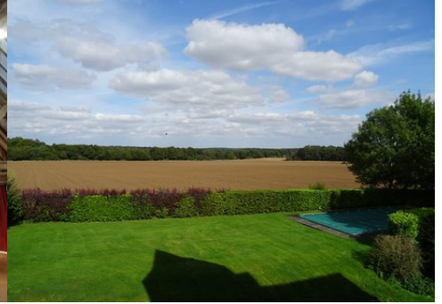
La vue vers les champs au Nord

Pour la zone en rose foncé dans le périmètre de 500m