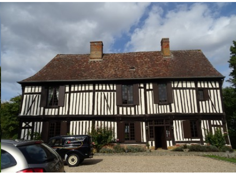
La façade sud du manoir (vue proche)