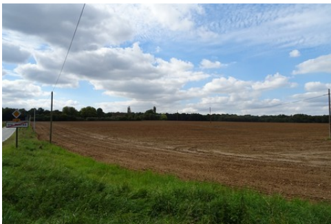
Le domaine vu de la lisière du village

Les avis seront cohérents avec ceux émis ces dernières années, à savoir : pas de maisons à volume compliqué (type V, W, Y, ou Z), pentes à 45° pour les volumes principaux, ardoise ou tuile plate de teinte brun vieilli, à 20u/m 2 , avec un débord de toiture de 20cm, enduit de teinte beige clair avec modénatures (au choix : chaînages, encadrement de fenêtres, soubassement, colombage...). *Voir les autres fiches.